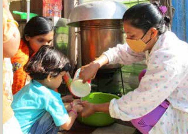
▲ The ASHA worker demonstrates proper handwashing technique with soap