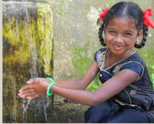
▲ शाळेत हात धूत असलेली विद्यार्थिनी

१०३ शाळांमधील प्रत्येक मुलाला साबणाचा एक बार प्रदान करण्यात आला, जो ते त्यांच्या संबंधित शाळांमधून गोळा करू शकतात. एकूण २६,००० साबणाच्या वड्यांचे वाटप करण्यात आले. कार्यक्रमांतर्गत सुचविलेल्या अभ्यासक्रमानुसार शिक्षकांनी विद्यार्थ्यांसाठी ऑनलाइन हात धुण्याचे सत्र आयोजित केले.