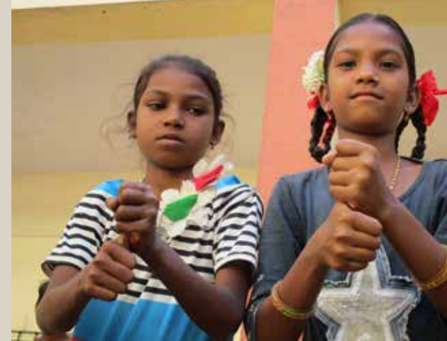
▲ Handwashing steps being demonstrated by students

program design. On request, a follow-up face-to-face training was also organized for the teachers in batches.