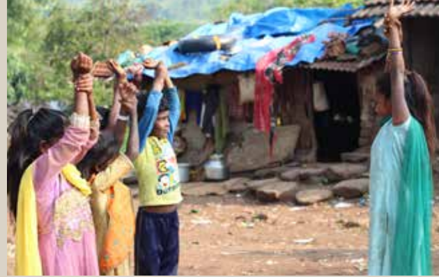
▲ Children at Sundarwadi have been enthusiastic participants in the handwashing campaign