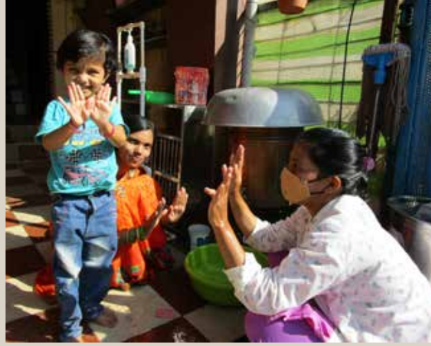
▲ आशाच्या कार्यकर्ती ला पूजा तिचे स्वच्छ हात दाखवत असताना