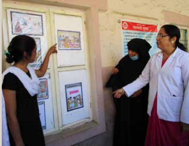
▲ A panel at the NIMA health centre informing of the benefits of handwashing