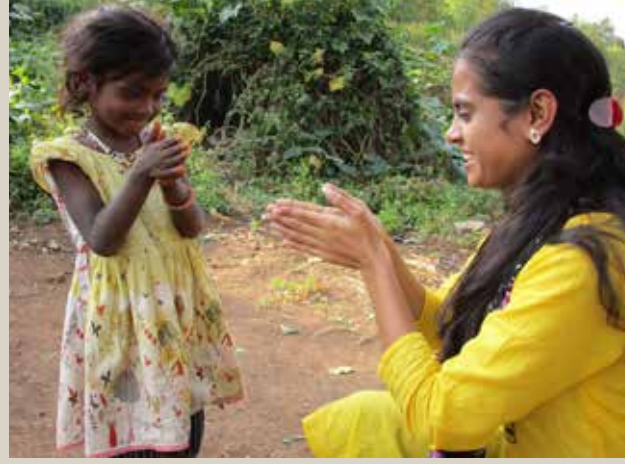
▲ सुंदरवाडीत हात धुण्याच्या मोहिमेत मुलं उत्साहाने सहभाग घेत असताना