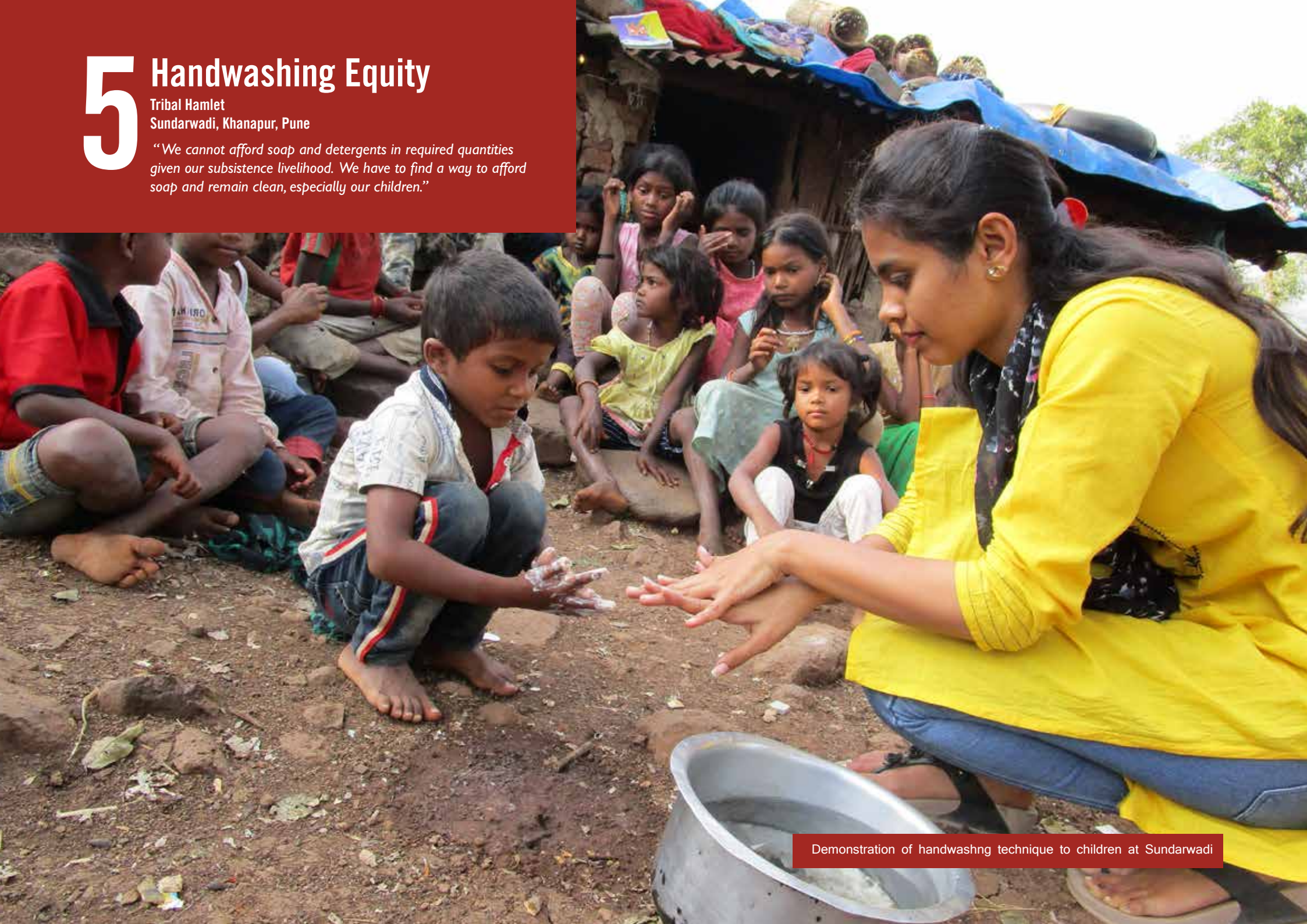
Demonstration of handwashing technique to children at Sundarwadi

“We cannot afford soap and detergents in required quantities given our subsistence livelihood. We have to find a way to afford soap and remain clean, especially our children.”